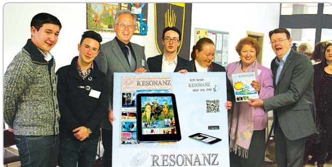
RESONANZ-MediaNetzwerk am 29. April 2013 in Fürth

Seit 2005 gibt RESONANZ in einem professionellen Mix aus aktuellem Journalismus und kompetentem Sprachtraining ein abwechslungsreiches Bild vom interkulturellen Leben in der Metropolregion Nürnberg. Kurze Nachrichten und große Reportagen, Interviews und Berichte rund um die Themen Lifestyle, Gesellschaft, Wirtschaft, Recht, Forschung, Gesundheit, Reise, Weltliteratur, Bildung, Mehrsprachigkeit wechseln sich ab. Das jeweils neueste Heft ist kostenlos erhältlich an rund 1800 Auslagestellen in der Metropolregion Nürnberg, sowie auf bestimmten Veranstaltungen. Dazu ist RESONANZ in mehrsprachigen Bildungseinrichtungen in 47 Staaten verbreitet und im Internet unter resonanz-medien.de abrufbar.