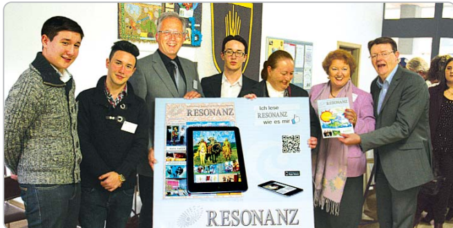
RESONANZ-MediaNetzwerk am 29. April 2013 in Fürth

Seit 2005 gibt RESONANZ in einem professionellen Mix aus aktuellem Journalismus und kompetentem Sprachtraining ein abwechslungsreiches Bild vom interkulturellen Leben in der Metropolregion Nürnberg. Kurze Nachrichten und große Reportagen, Interviews und Berichte rund um die Themen Lifestyle, Gesellschaft, Wirtschaft, Recht, Forschung, Gesundheit, Reise, Weltliteratur, Bildung, Mehrsprachigkeit wechseln sich ab. Das jeweils neueste Heft ist kostenlos erhältlich an rund 1800 Auslagestellen in der Metropolregion Nürnberg, sowie auf bestimmten Veranstaltungen. Dazu ist RESONANZ in mehrsprachigen Bildungseinrichtungen in 47 Staaten verbreitet und im Internet unter resonanz-info.de abrufbar.