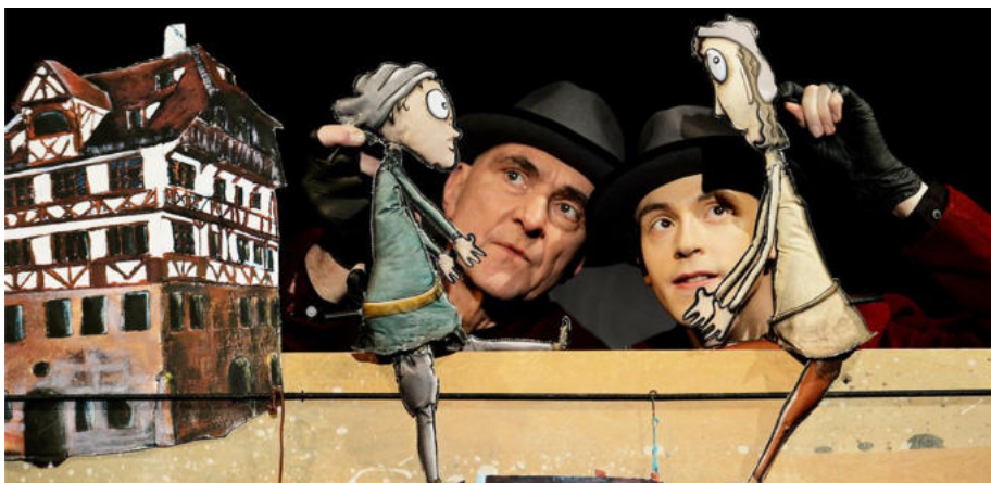
Оскар и тайна.