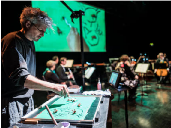
Карнавал животных.

А какое занимательно-ироничное и совершенно фантастическое представление "Карнавал животных" подготовил Thalias Kompanions and ensemble-KONTRASTE из Нюрнберга! Ну кто же мог бы предположить, что корова сможет стать слоном, кенгуру - пингвинами, а мышь превратится в носорога?! Рукотворные чудеса, краски, магия анимации и мастерство всей команды театра делают это просто удивительно.