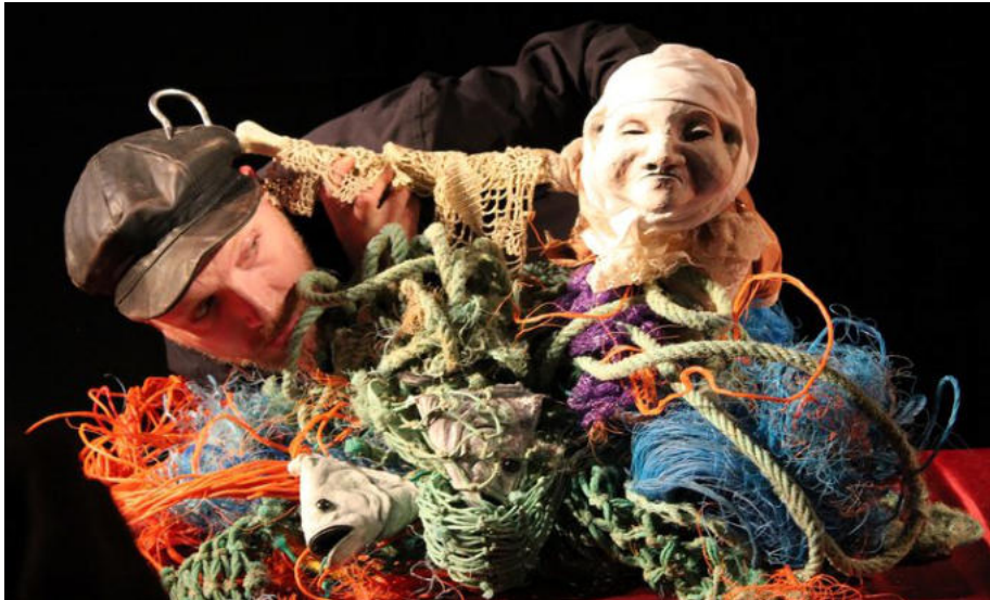
Под водой.